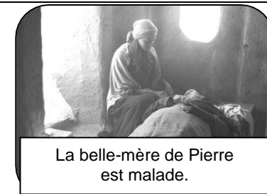
La belle-mère de Pierre est malade.